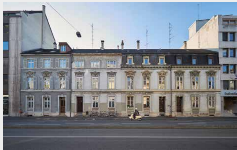
Shtëpitë në Steinengraben, të cilat që një kohë të gjatë gjenden në pazgjidhshmëri me pronarët : Sigurimi Helvetia do që t'i rrënon për të ndërtuar ndërtesë zyresh.

e kanë fituar përsëri hapësirën e tyre të banimit me kushte të volitshme pas shumë viteve ankimesh dhe përpjekjesh.