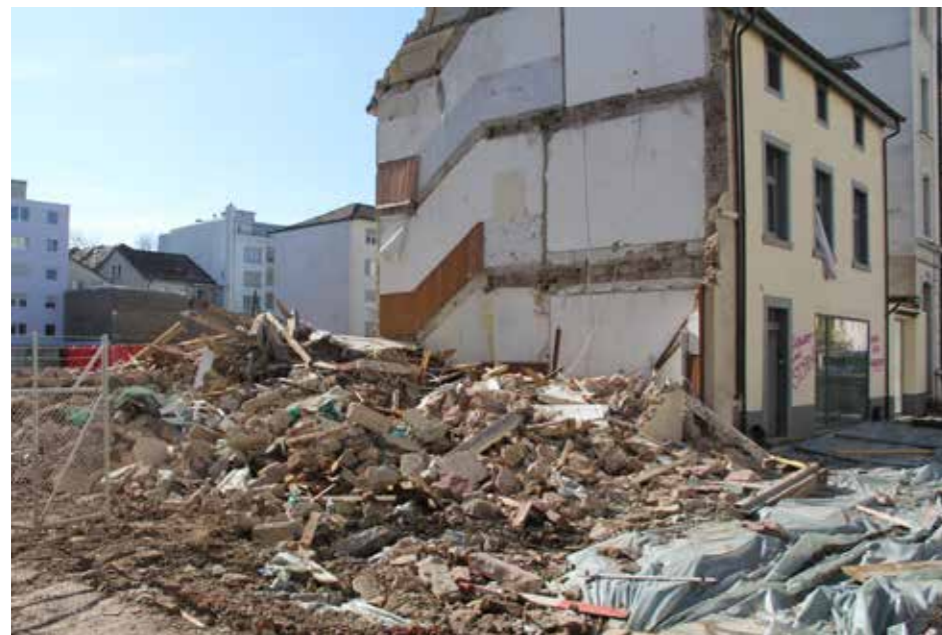
«Vila Carmen» është rrënuar në vitin 2016 dhe të gjithë qiraxhinjtë janë dëbuar.

banesat. Banesat me qira te arsyeshme shndërrohen në banesa me qiraxhi pronarë ose pas renovimeve me qira te larta. Hapësira e banimit bëhet si mjet fitimi. Vetëm një numër i vogël i banuesve i goditur nga kjo dukuri arrijnë të mbrohen apo kundërshtojnë.